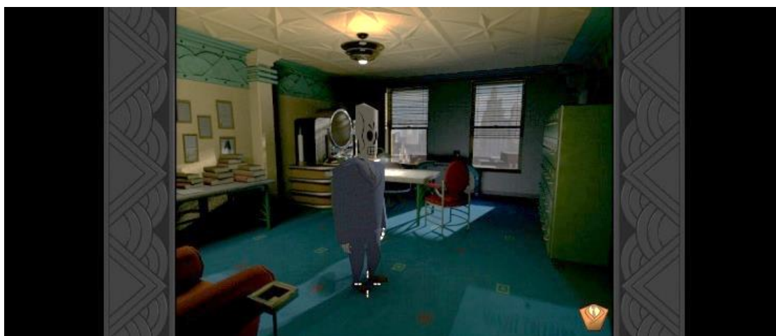
Figura 1: Captura de tela do Jogo Grim Fandango Remastered.