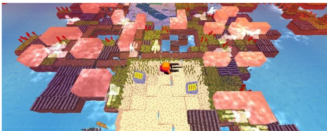
Figura 2: Captura de tela do jogo Stephen's Sausage Roll